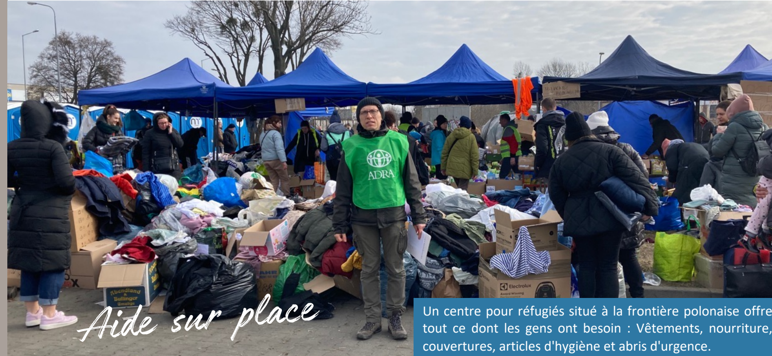
Un centre pour réfugiés situé à la frontière polonaise offre tout ce dont les gens ont besoin : Vêtements, nourriture, couvertures, articles d'hygiène et abris d'urgence.

La volonté d'aider de la population des pays voisins directs de l'Ukraine est énorme. Des tonnes de vêtements, de couvertures, de matelas, de nourriture et d'articles d'hygiène ont été donnés et sont acheminés vers les frontières où ils sont distribués dans les centres de réfugiés.