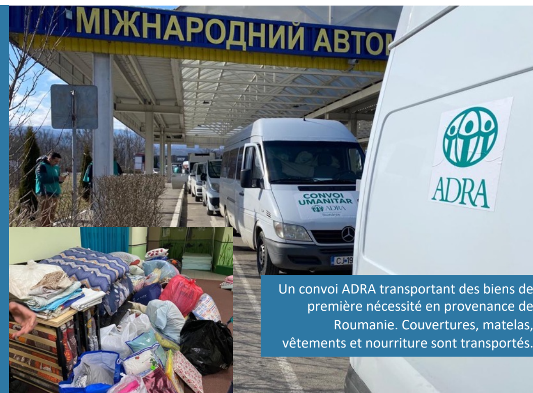
Un convoi ADRA transportant des biens de première nécessité en provenance de Roumanie. Couvertures, matelas, vêtements et nourriture sont transportés.