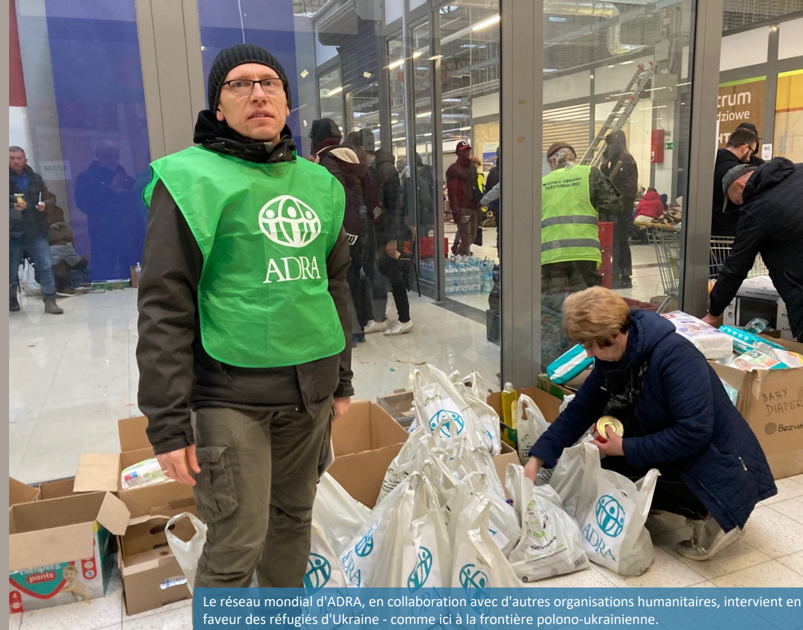
Le réseau mondial d'ADRA, en collaboration avec d'autres organisations humanitaires, intervient en faveur des réfugiés d'Ukraine - comme ici à la frontière polono-ukrainienne.